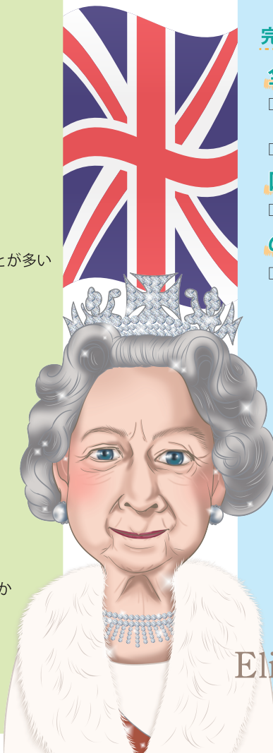
Elizabeth the Second